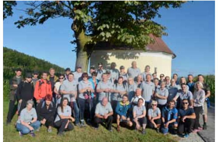
Die Wanderer beim Kogler Kreuz.

Kreuz eine Eierspeisjause beim Almerschmied. Dadurch gestärkt wurde dann die zweite Etappe zum Mesnerhäusl in Angriff genommen. Dort gab es dann ein gemütliches Beisammensein bei Speis und Trank bis zum späten Nachmittag.