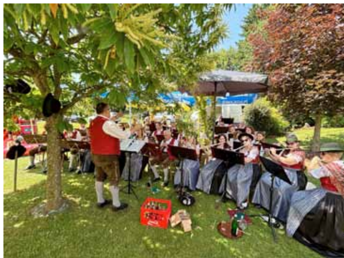
Fronleichnam im Gastgarten/Eichbergerhof Kohl

In der KW 25 stand der MKE ein musikalisches verlängertes Wochenende bevor. Bereits zu Fronleichnam umrahmte die Musikkapelle Eichberg die heilige Messe. Im Anschluss folgte der all-