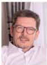
Bürgermeister Günther Putz